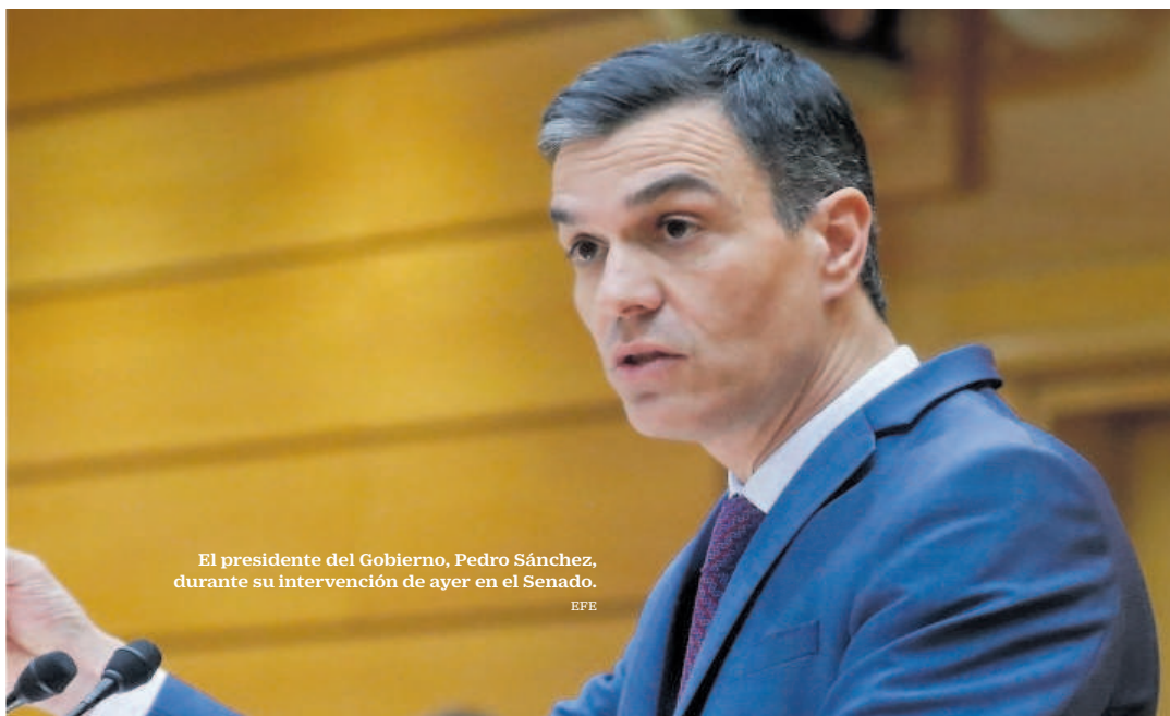
El presidente del Gobierno, Pedro Sánchez, durante su intervención de ayer en el Senado.