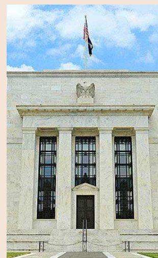
Sede de la Reserva Federal.