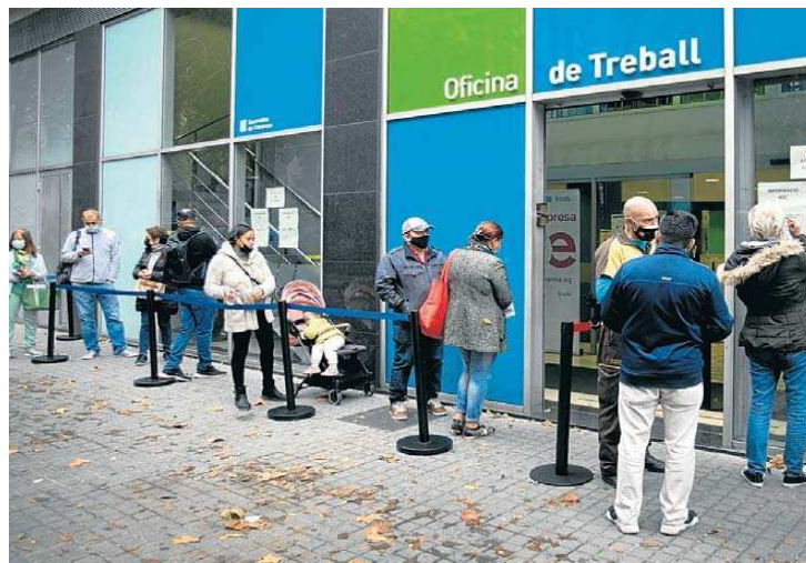
Cues a les oficines del SOC i el SEPE durant la pandèmia.