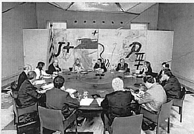
El Consell de Govern, en su reunión de ayer.