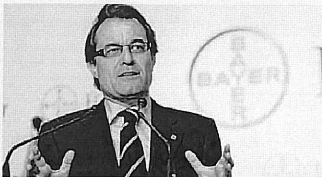
El presidente de la Generalitat, Artur Mas.

La Generalitat ha admitido que su déficit rondará el 2,6% del PIB para este año