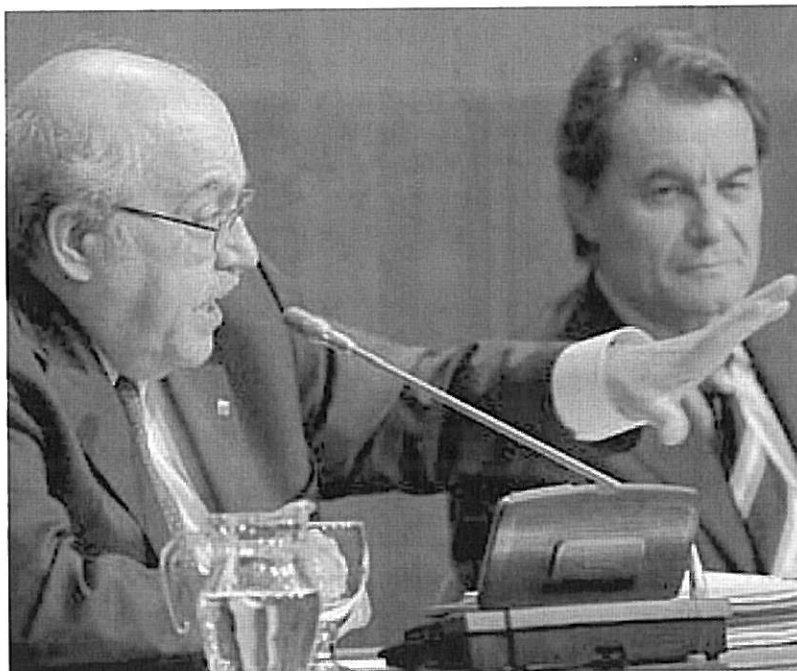
El consejero de Economía, Andreu Mas Colell, y el presidente catalán, Artur Mas.

Ahora lo que la dirección de Política Financiera de la Generalitat pretende es rebajar el nivel de comisiones bancarias y así, pese a elevar la retribución para el particular hasta en 1,75 puntos, según los casos (lo que supone un aumento de hasta el 41 por ciento), lograr que