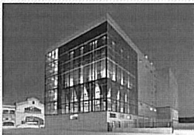
El centre d'investigació i producció de farina inau- gurat el desembre passat. CASA TARRADELLAS

Casa Tarradellas va facturar 630 milions d'euros el 2010