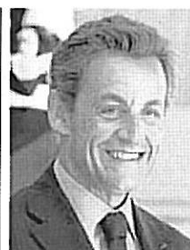
PRIMER CLIENT. Nicolas Sarkozy.

El Regne Unit i, sobretot, Turquia, van donar també una forta contribució als bons resultats del sector exterior de Catalunya. El país de les illes Britàniques va registrar un augment en la importació de productes catalans de 114 milions d'euros, que representen un increment en percentatge de quasi el 20%. En el cas de Turquia, la pujada va arribar a un espectacular 52,2%, amb 102 milions més en compres de producte made in Catalonia .