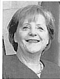
FORT CREIXEMENT. Angela Merkel.

amb una baixada de l'11,2% en termes relatius, i és l'únic país dels vint principals clients dels productes catalans on s'han reduït les exportacions.