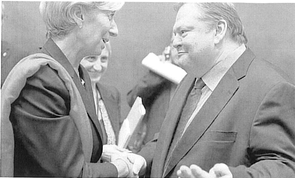
La ministra francesa de Finances i aspirant a dirigir l'FMI, Christine Lagarde, saluda l'acabat d'estrenar col·lega grec, Evangelos Venizelos, poc abans de començar la reunió de l'Eurogrup.