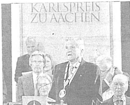
El premio Carlomagno 2011, Jean-Claude Trichet.

Trichet, que dejará la presidencia el próximo 31 de octubre tras ocho años en el cargo, completó su propuesta con otra más urgente, a su juicio, y sin duda más conflictiva: la de que Bruselas asuma el control de la política económica en los países que, tras ser rescatados por la zona euro, no aplican el ajuste presupuestario exigido. El Carlomagno 2011 no mencionó a Grecia. Pero en la Sala quedó claro quién perdería su soberanía al primer mandoble.