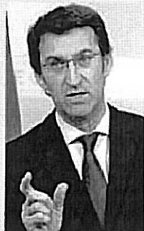
Alberto Núñez Feijóo.

El consejo no recibió ninguna explicación sobre los condicionantes que el día an-