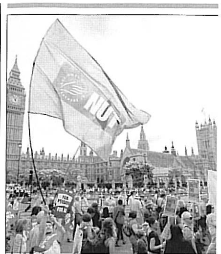
Uns vint mil treballadors del sector públic es van manifestar ahir a Londres contra les retallades

D'altra banda, Passos Coelho també va anunciar la intenció d'avançar al tercer trimestre d'aquest mateix any els plans per a la venda de la participació de l'Estat en les companyies elèctriques Energias de Portugal (EDP) i Redes Energéticas Nacionales (REN). ■